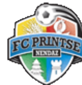
FC Printse Val d'Hérens